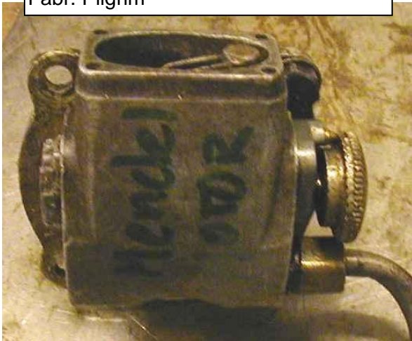
Ölpumpe Model B, C, D (ab Bj. 1927), Fabr. Pilgrim